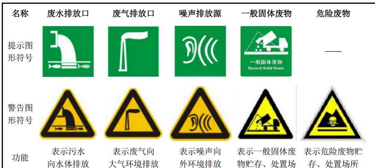
图3 各排污口（源）标志牌设置示意图